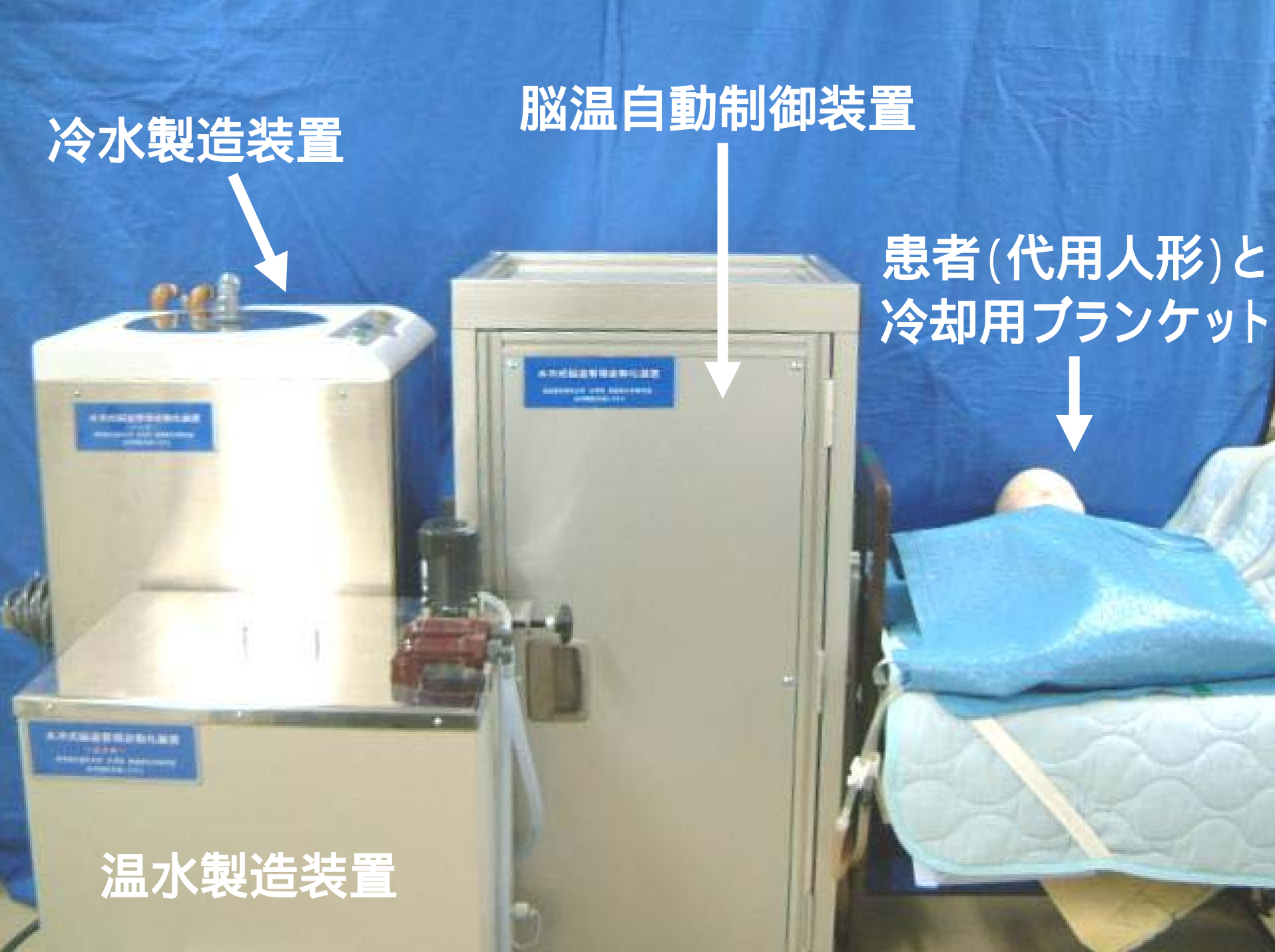
図1 成人を対象にした脳温自動制御装置