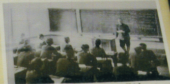
昭和七年文乙九期生へのマルクスに関する カルシュ氏の講義風景